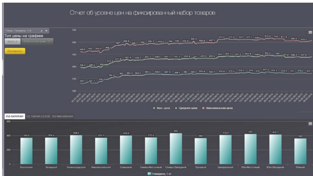
Рис. 8. Подсистема мониторинга цен на продукты и услуги.

Есть и весьма значимые финансовые результаты проекта. Расходы на сопровождение программ для ведения бухгалтерского учета в органах власти и бюджетных организациях сократились на 88 %. «Мы уже сейчас снизили расходы на эксплуатацию бухгалтерских систем, мы экономим на этом более 1 миллиарда рублей в год, — отмечает Артем Ермолаев. — Именно столько город тратил на поддержание локальных систем разных вендоров». Важно отметить, что цифра в 1 млрд рублей в год не учитывает всех показателей эффективности. «Это минимальный эффект, так как это экономия только прямых затрат, — дополняет Кирилл Кузнецов. — Эффект от реализации системы по модели SaaS можно разделить на организационный и